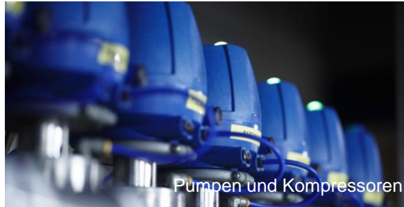
Pumpen und Kompressoren